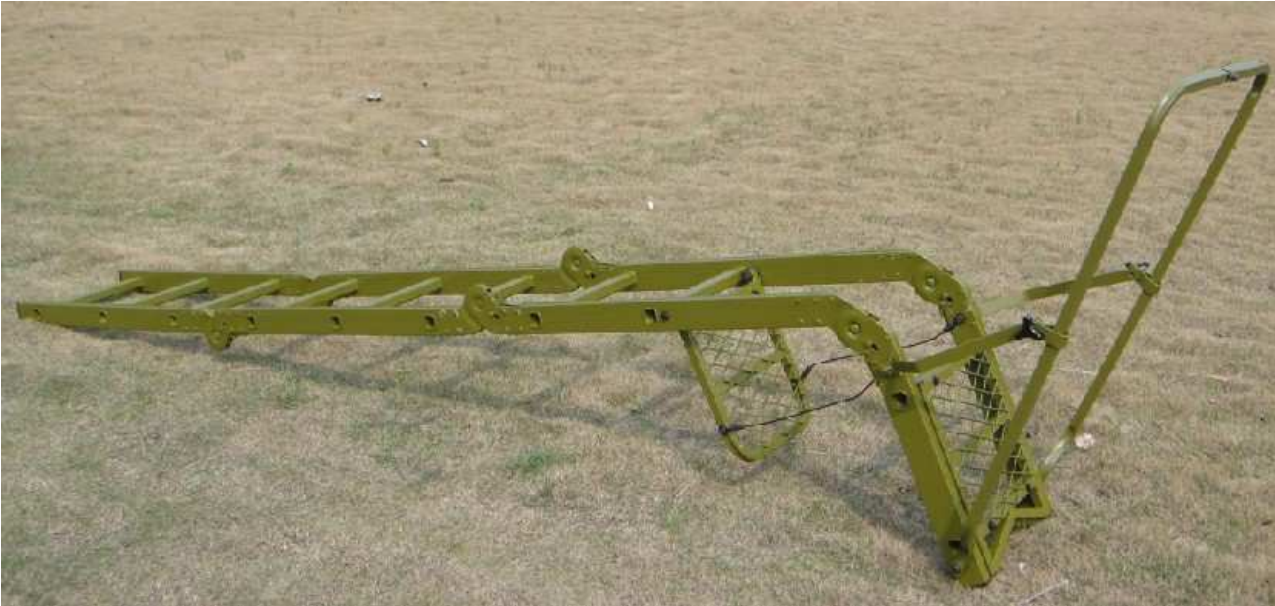
Der Baumsitz Waschbär ist nun fertig zur Baummontage montiert.